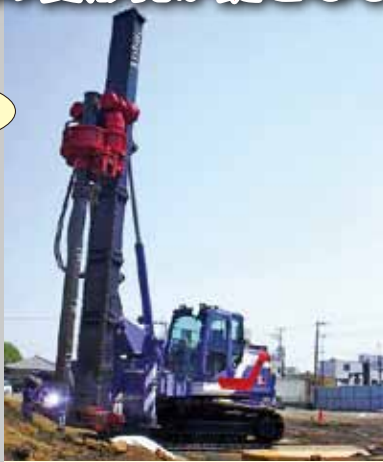
(仮称)某ビル新築工事