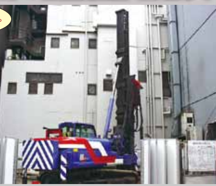
某テナンドビル新築工事

杭の種類 φ355.6 mm L=20.0m Dw750 mm 8set △ 本物件は人通りの多い繁華街に建設される店舗の基礎杭工事です。課題となった点は設計深度に到達させる迄の中間層を貫入できる事。また、作業スペースが限られているためコンパクトな杭打ち機を用いて確実に支持層までの打ち抜きの可否が問われた。 ◎ 昨年弊社にて導入しました。幅2490mm・最大トルク199kN・m 杭打ち機、MD-200を使用する事により、限られた作業スペースでの施工は可能となり、また、e-pile工法の最大の特徴となる杭先端の菱形孔と切削刃とが抜群の掘削性能を発揮し、スムーズに所定の設計深度まで貫入させる事ができました。また、事前に地中障害物の撤去や杭打ち機の足場養生を元請け様にご協力いただきスムーズに工事を完了することが出来ました。